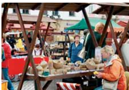
Součástí Svátků města bude i historický jarmark