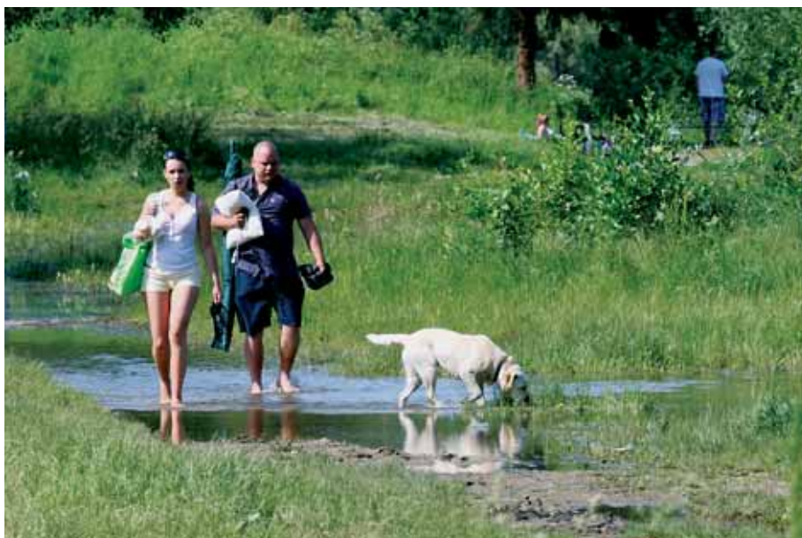
Květnové deště dočasně zvýšily hladinu jezera.

Během několika dní by se měla restaurace otevřít. V příjemném interiéru, stylizovaném jako paluba lodi s výhledem na jezero, ovšem možná nejprve budou dostávat hosté pivo a další nápoje do kelímku. „Máme zatím problémy s vodou ve studni pod restaurací. Jsou v ní totiž bakterie. Dokud se nám to nepodaří vyřešit pomocí úpravní vody, musí být lidé připravení na to, že asi budou dostávat pivo, limo a kávu do kelímků,“ vysvětlil Sedláček.