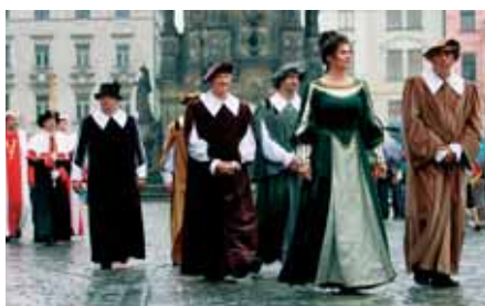
V průvodu jdou zástupci církve, představitelé města, univerzity a vojenské posádky

řů, žonglérů a hereckých společností. Zájemci z řad dětí si budou moct vyzkoušet své výtvarné umění při soutěži v kreslení na chodník. V 17 hodin vyrazí tradiční průvod v historických kostýmech, konaný ke cti svatě Pavlíny, patronky města, jejíž ostatky budou od 18 hodin vystaveny v chrámu svatého Mořice. Průvod vyjde od radnice přes Dolní náměstí, Panskou ulici, Žerotínovo náměstí, poté ulicemi Univerzitní, Denisova a Ostružnická zpět na Horní náměstí a Opletalovou ulici nakonec zamíří k chrámu svatého Mořice. Večer v 19 hodin zakončí páteční program koncert kapely Čechomor na Horním náměstí.