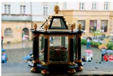
Ostatky svatě Pavlíny budou po průvodu vystaveny v chrámu svatého Mořice

Rovněž na Horním náměstí se bude v pátek odehrávat historický jarmark, jehož součástí je i expozice Hanáckého skanzenu Příkazy, koncerty několika historických kapel a vystoupení kejklí-